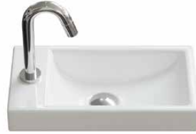
keramiek 40 cm. in 4 kleuren mogelijk