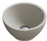
beton Ø 24 cm. in 7 kleuren mogelijk