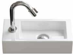
keramiek 37 cm.