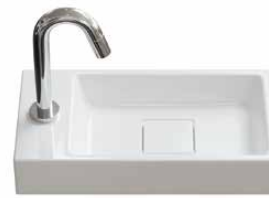
mineraalmarmer 1 40 cm.