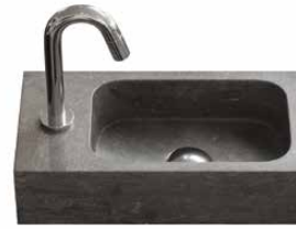
hardsteen 40 cm.