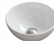
keramiek 2 Ø 26 cm. in 3 kleuren mogelijk