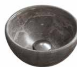
hardsteen Ø 23 cm.