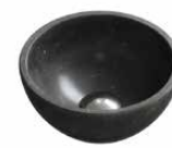
basalt Ø 23 cm.