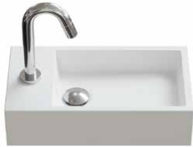
solid surface 40 cm.