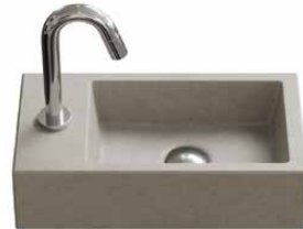
beton 40,5 cm. in 7 kleuren mogelijk