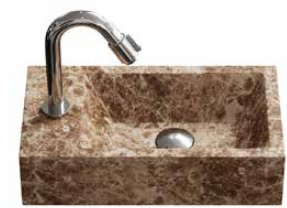
emperador marmer 40 cm.