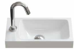
mineraalmarmer 2 40 cm.