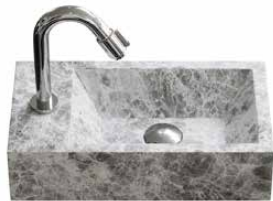
emperador marmer 40 cm.